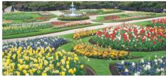
Prawidłowe rozgraniczenie ułatwia pielęgnację.